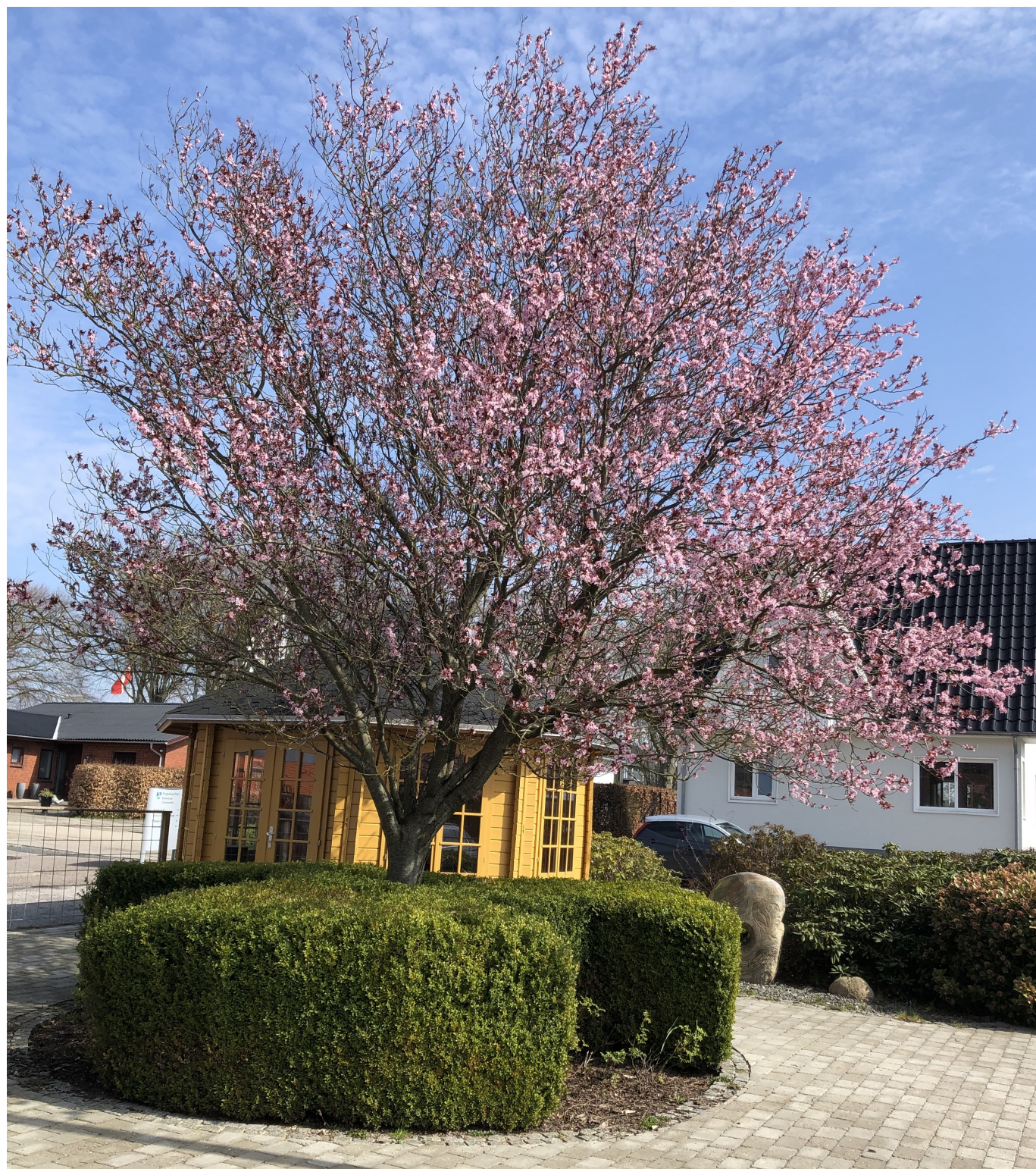
Forårmotiv fra Centerparken